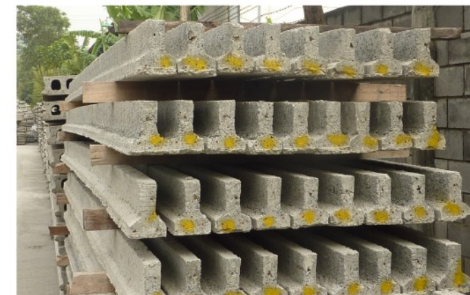
6. T-Beam Precast untuk lantai tanpa menggunakan mobil crane