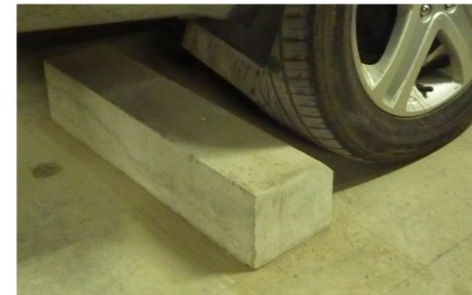
4. Car Stopper