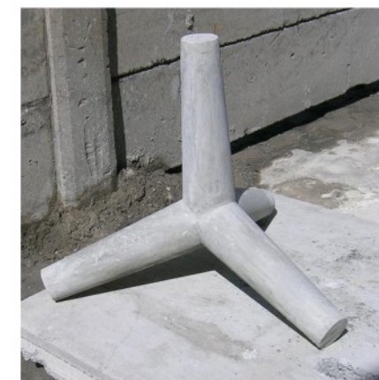
8. Precast Penahan Gelombang