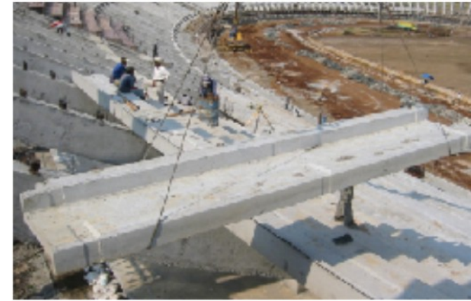
1. Tempat duduk precast untuk stadion outdoor