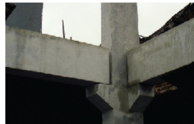
7. Balok & Kolom Precast