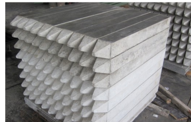
5. Patok Kavling Tanah