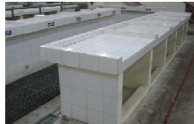
3. Meja Precast