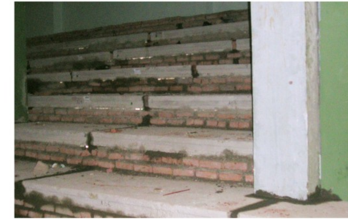
2. Tempat duduk precast untuk gedung olahraga indoor